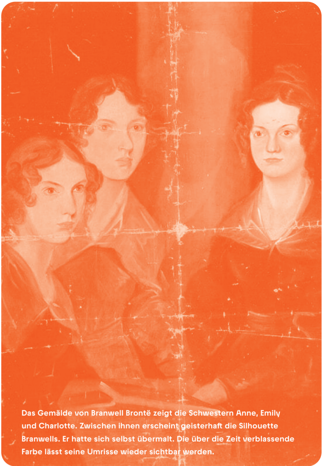
Das Gemälde von Branwell Brontë zeigt die Schwestern Anne, Emily und Charlotte. Zwischen ihnen erscheint geisterhaft die Silhouette Branwells. Er hatte sich selbst übermalt. Die über die Zeit verblässende Farbe lässt seine Umrisse wieder sichtbar werden.