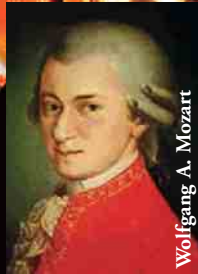
Wolfgang A. Mozart